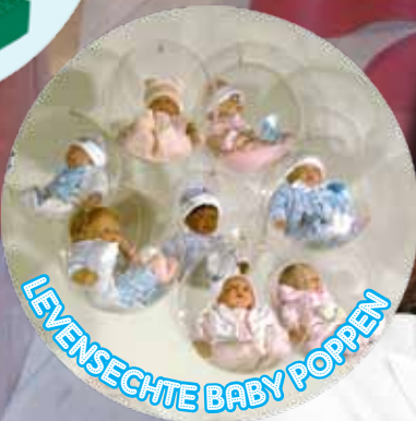
LEVENSECHTE BABY POPPEN